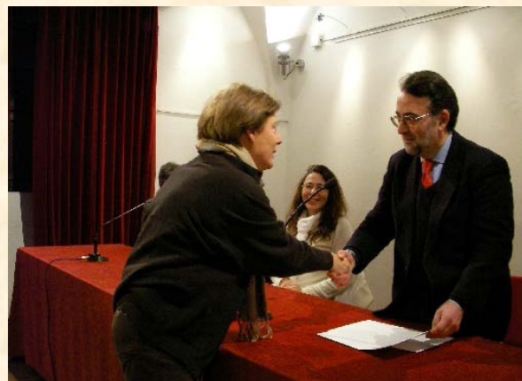
Benedos Lucia Settore 19 Consulenza professionale attitudinale e ricerca falsi su manoscritte