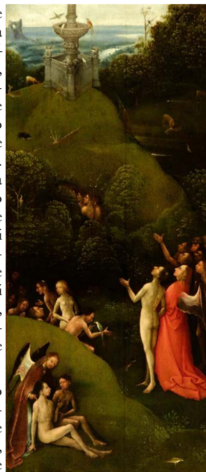
Bosch, Visioni dell'Aldilà, Paradiso terrestre

"Bosch e Arcimboldo si pongono nel panorama dell'arte come figure innovative"