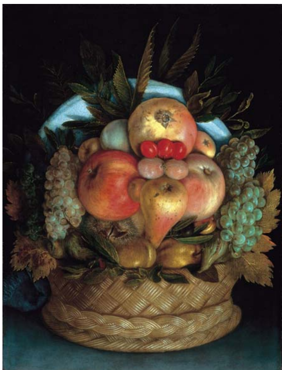
G. Arcimboldo, Testa reversibile con canestra di frutta

dendosi, accoglie angeli e beati. Cupi ed inquietanti sono i pannelli Caduta dei dannati e Inferno , pervasi dal fuoco, da una livida luce e dalla sofferenza.