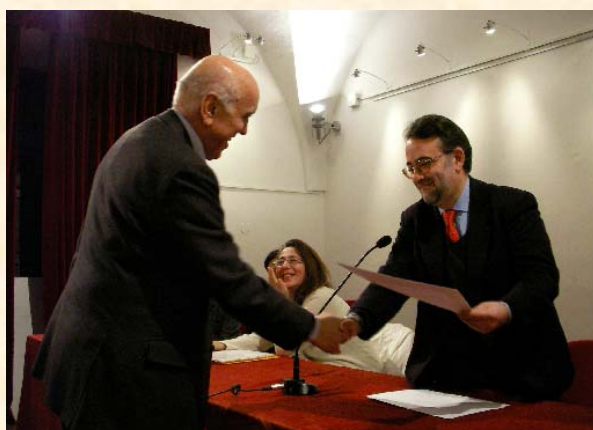
Galfrè Lorenzo Settore 13 Argenteria, Gioielleria, Pietre preziose