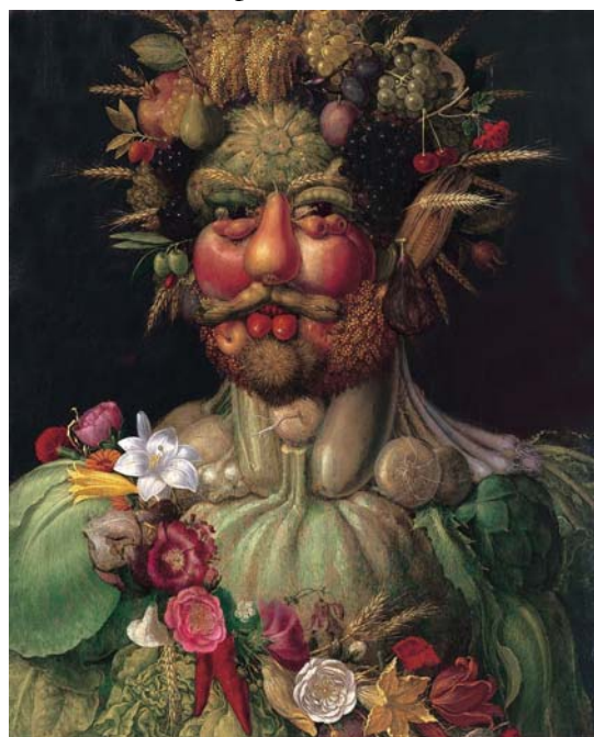
G. Arcimboldo, Vertumno , Ritratto di Rodolfo II, 1590

Mentre l'Umanesimo nella nostra cultura esalta l'intelletto e la forza dell'uomo, Bosch nelle sue opere